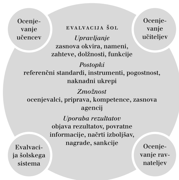
SLIKA 1 Evalvacija šol v okviru evalvacije in ocenjevanja

V pregledni študiji OECD so opredeljene smernice za razvoj politike evalvacije šol, ki jih navajamo in nekatere podrobneje pojasnujemo v nadaljevanju.